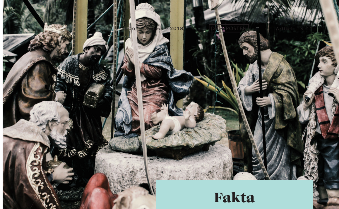
Det blev forudsagt i Det Gamle Testamente at Jesus skulle være en frelserkonge.

Budskabet er et glædesbudskab, for der fødes en frelser. Han skal genoprette forholdet mellem menneske og Gud, når han bringer tilgivelse, fred og liv. Dette er glæden. Frelseren er af Davids slægt, og han er Messias. Der er løfter i GT om en