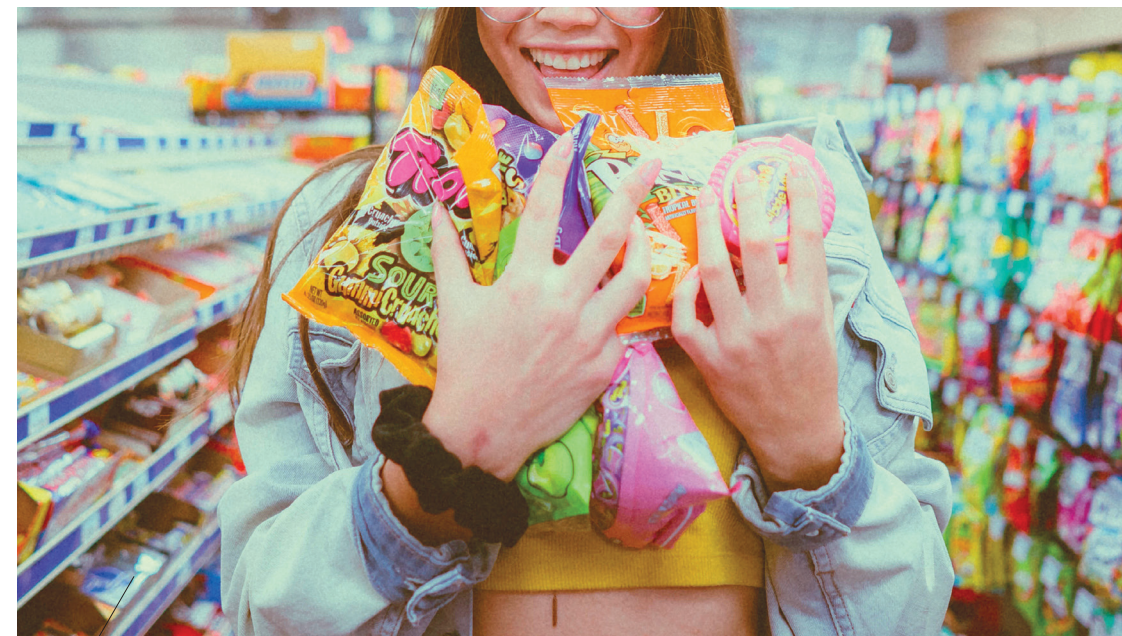
Materialismen inviterer mennesket til at ophøje og tilbede det materielle fremfor Skaberen af det materielle.

Som kristen kan det være fristende at løse problemet ved at nedtone de materielle tings betydning. Der kan endda findes en form for bibelsk belæg for at gøre dette med henvisning til et par Jesus citater som fx: "Giv Gud, hvad Guds er og kongen, hvad kongens er". Eller man kan læse fortællingen om den unge mand, der gik bedrøvet bort fra Jesus – "for han var meget velhavende" (MATT 19,16-22). Der findes i kirkehistorien mange ekstreme eksempler på materiel forsagelse, men faktisk tror jeg også, vi mange steder i kristen-Danmark ender i en slags "light-forsagelse" i vores opgør med overdreven materialisme. Nemlig at vi gør de åndelige dele af troen til noget særligt fint. Vi fremhæver og ophøjer forkyndelsen, lovsangen og bønner, mens vi samtidig taler om,