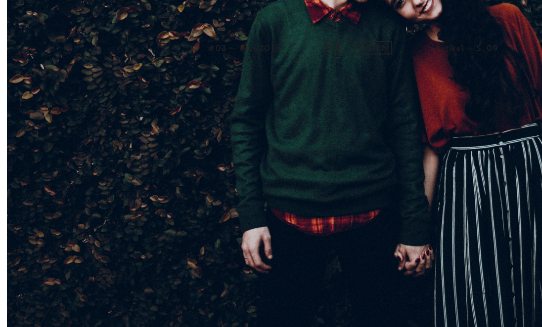
Heim eller hvad er din afgud?