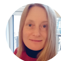
ELISE Praktisk teologi

” Kirkehistorien er på mange måder fundamentet for, at vi kan forstå, hvem vi er.