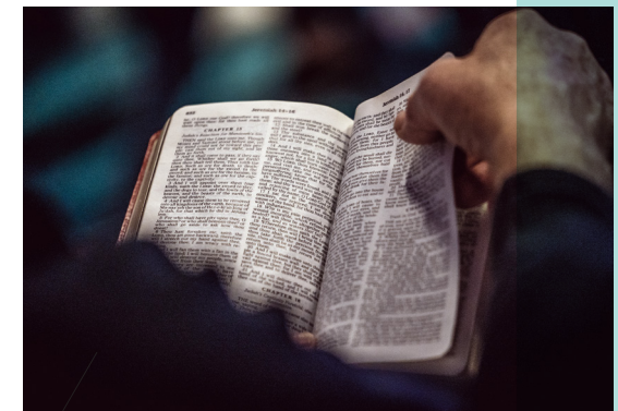
Når vi oplever modstand, må vi med udholdenhed holde fast i Guds ord.

Vi har hver især en rolle at spille i Guds menighed. For nogle er den konkret: Fx som leder i børneklubben, menighedsrådsmedlem, forkynder, musiker, forbeder el.lign. Vores engagement i en sådan tjeneste er heller ikke statisk. Vi kan miste modet, lysten og energien, hvis tilslutningen er lille, hvis vi får urimelig kritik eller hvis vi ikke synes, at der kommer noget resultat ud af vores anstrengelser. Så er det tid til udholdenhed i tje-