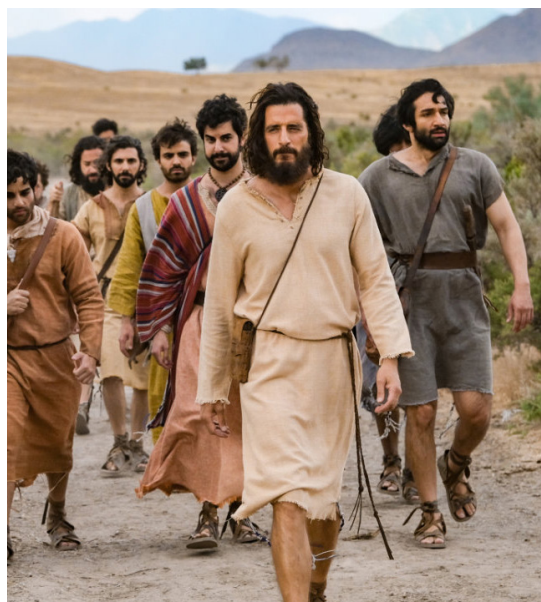
Lukas opfordrer til at reflektere over, hvad serien fortæller – eller ikke fortæller – om Jesus.

Jo mere, jeg reflekterede over seriens indhold, jo mere blev jeg klar over, at alt måske ikke var fryd og gammen. Det gik gradvist op for mig, at serien begyndte at tilføje dialoger og begivenheder, som ikke kan genfindes i Bibelen. En kulmination af