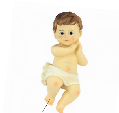
Guds søn gav afkald på sin guddommelige status for at frelse os.

Jul er tid for stearinlys med varm krydret gløgg i kruset og julemusik i radioen. Men jul er også meget mere.