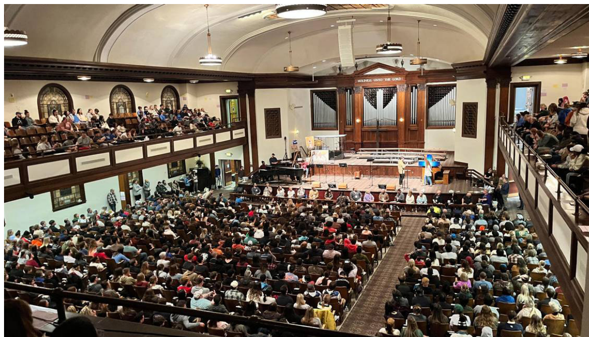
En helt almindelig skoleandagt på det kristne Asbury universitet i Kentucky, USA, udviklede sig til bøn- og lovsangsmøder med stor tilstrømning.

Det, der sker, kan få os til at tænke på, om en større vækkelse er på vej. Samtidig kan vi opleve, at Gud tilskynder til at bede konkret om væk-