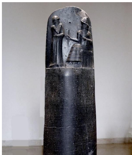
Hammurabis Lov.