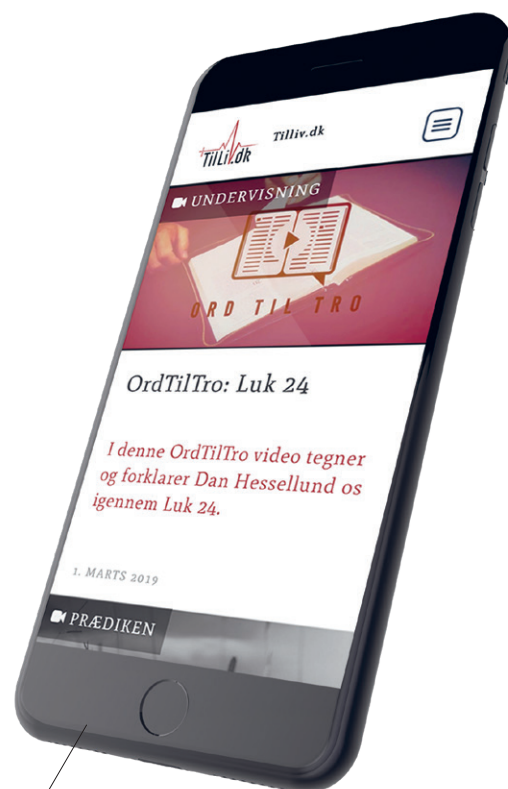
Tre studerende lancerer god forkyndelse på ny online platform.

Norea har i mange år arbejdet med mediemission – både ude og hjemme, men de har manglet en