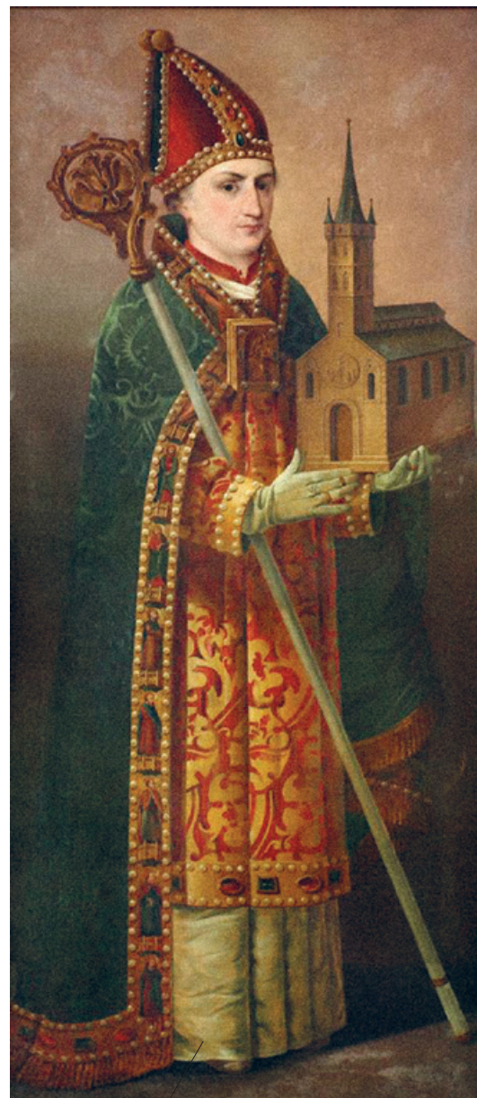
Ansgar var med til at bane vejen for en officiel kristen kirke i Danmark.

Ansgars første missionsindsats i Danmark skete netop i tilknytning til nogle politiske begivenheder. Efter at den danske konge, Godfred, var blevet myrdet i 810, opstod der en kamp om den danske trone. En af kandidaterne til at efterfølge Godfred, Harald Klak, søgte hjælp hos den frankiske kejser og måtte som betingelse for støtte herfra gå over til kristendommen. Da Harald efter sin døb i 826 rejste tilbage til Danmark, sendte man to munke med for at hjælpe ham med at blive bevaret i den kristne tro og samtidig benytte anledningen til at missionere i Danmark. En af