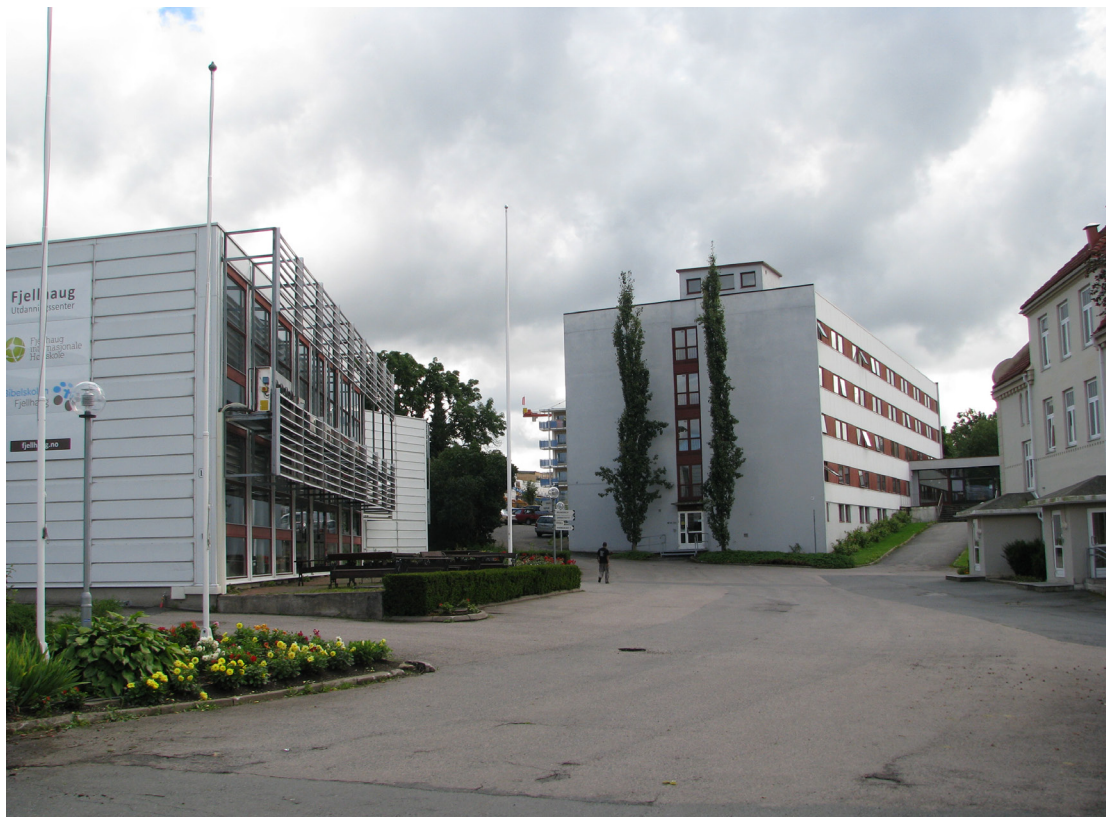
Fjellhaug internasjonale Høgskole ligger i centrum af Oslo og blev oprindeligt startet i 1898.

→ | Samarbejdet med Fjellhaug internasjonale Høgskole handler først om fremmest om en ny spændende uddannelse i teologi og mission.