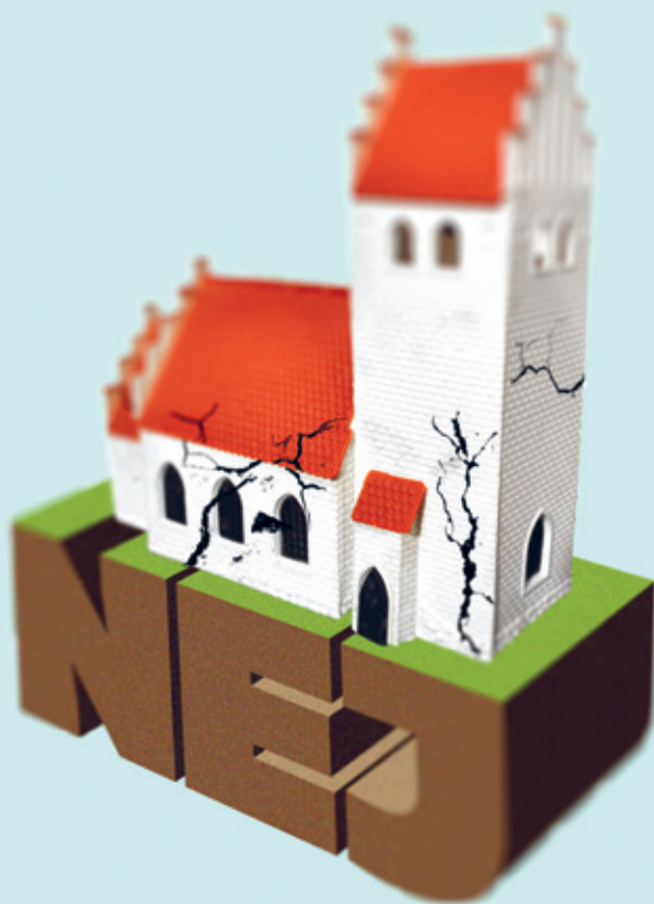
ILLUSTRATION: CHR. RAHBEK OLSEN

→ | Der kan ikke bygges kirke på et nej alene. Men der kan heller ikke bygges kirke uden et nej.