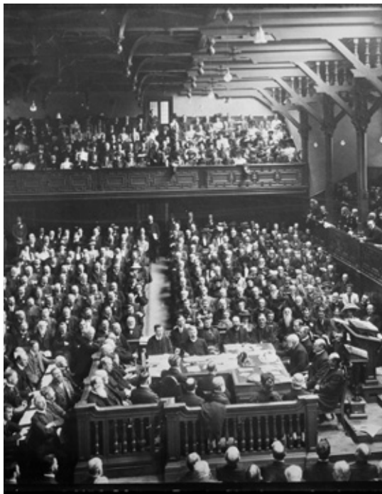
Verdensmissionskonferencen 1910 i Assembly Hall på University of Edinburgh.

Konferencens mest direkte resultat var beslutningen om en fortsættelseskomite, der skulle fastholde missionsorganisationerne på konfe-