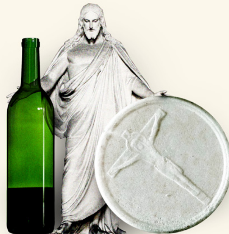
ILLUSTRATION: CHRISTIAN RAHBEK OLSEN

Jeg mener ikke, at vi bare skal indbyde alle. Men vi skal heller ikke indbyde sådan: "Nadveren er for mennesker, der vil tage imod Jesus i tro". Selv om det er rigtigt, bør det ikke siges eksplicit i en nadverindbydelse, da den anfægtede så måske ikke tør deltage. Indbydelsen skal ikke udtrykkes eksplicit, men hele måden tingene sker på, skal være en indbydelse til den, der har