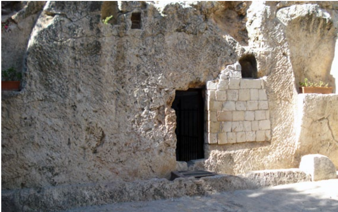
Dette er gravstedet i Jerusalem, hvor Jesus ifølge traditionen menes at have ligget begravet.

"Jeg overleverede jer nemlig først og fremmest, hvad jeg også selv har modtaget: at Kristus døde for vore synder efter Skrifterne, at han blev begravet, at han opstod på den tredje dag efter Skrifterne, og at han blev set af Kefas og dernæst af de tolv. Dernæst blev han set af over fem hundrede brødre på én gang, de fleste af dem er endnu i live, men nogle er sovet hen. Dernæst blev han set af Jakob, siden af alle apostlene. Men sidst af alle blev han også set af et misfoster som mig." 1 Kor 15,3-8