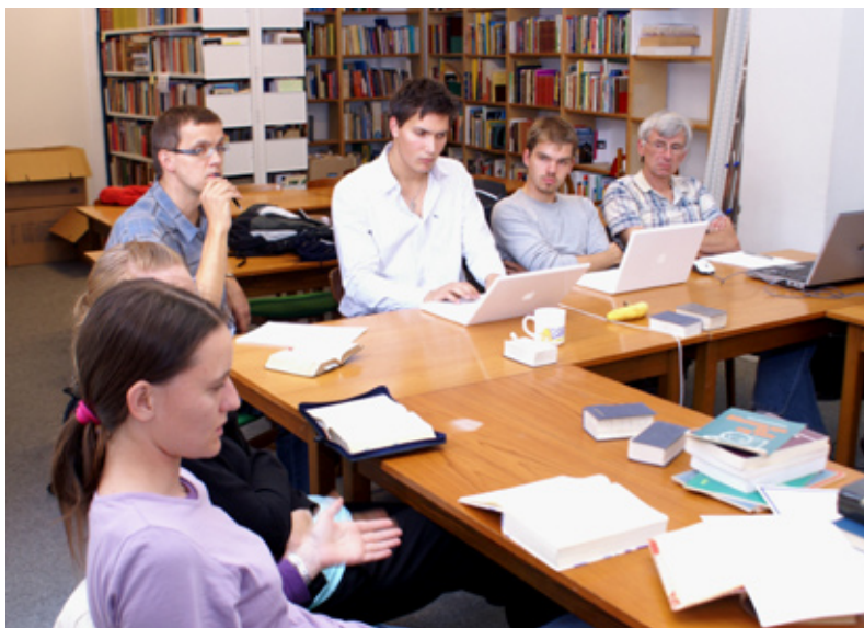
DBIs bachelor er både for dig, som ønsker en klassisk teologisk uddannelse, og dig, som ønsker at uddanne dig til tværkulturel mission.

80 procent af fagene i vores nye bachelor er klassiske teologiske fag. De sidste 20 procent er praktikforløb, en 3-ugers studietur til udlandet og fag indenfor kultur, kommunikation og mis-