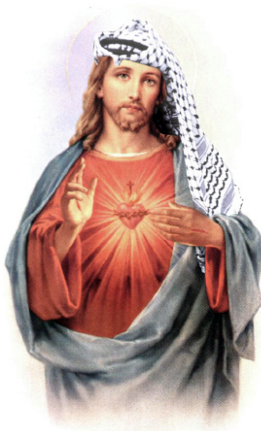
ILLUSTRATION: CHR. RAHBEK OLSEN

Den helt centrale forskel til Bibelens beskrivelse af Jesus er, at hans død kun omtales ganske få steder, og at den ikke skyldtes korsfæstelse. Jøderne troede godt nok, at de korsfæstede ham, men Gud havde taget ham til sig og lod en anden blive ydmyget på korset, for Gud kan ikke svigte sine egne. Det handler altså ikke bare om, at islamisk teologi ikke rummer forsoningens mysterium og derfor ikke har brug for Jesu død, men lige så