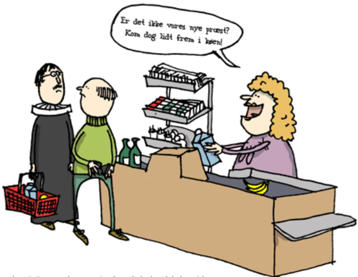
ILLUSTRATION: CHR RAMBEK OLSEN

Grund nr. 9: En præst har enestående muligheder i lokalområdet.