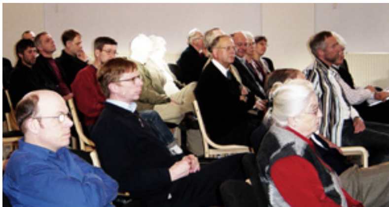
Årsmødet 2008 holdes i Ølgod.

Om dagen samles DBIs styrelse og nogle ansatte til bestyrelses-