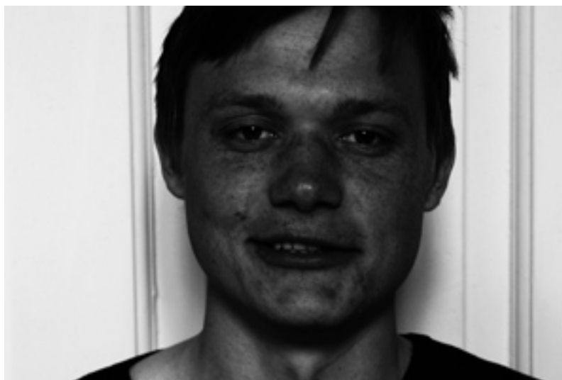
kristendommen, når den kommer til Afrika, hvad der bliver lagt særlig vægt på, og hvordan den bliver præget af kulturen. Desuden vil Christian ikke afvise en fremtidig præstetjeneste, og derfor er det godt at have en cand.theol. i baghånden.