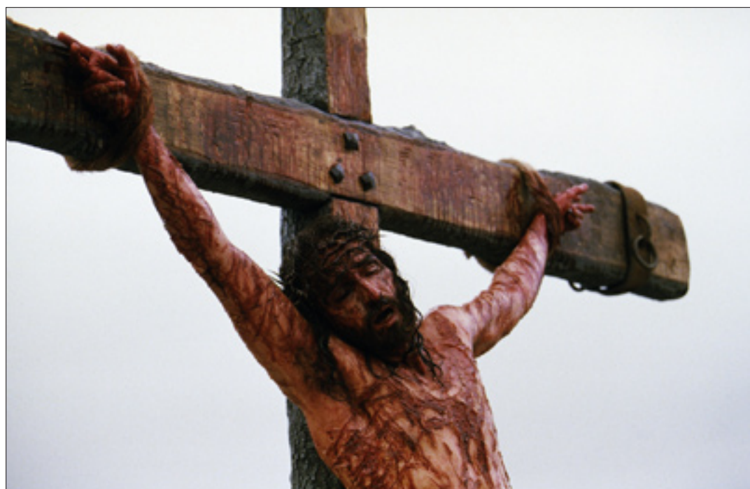
Mel Gibsons The Passion of the Christ (2004) satte i den grad billeder på, hvordan Jesu lidelse var.

I forrige udgave af DBIposten viste jeg, at Gud handler i Jesu Kristi død og opstandelse ved at besejre Djævelen, synden og døden. Svenskeren Aulén mener, at den 'klassiske forsoning' skal forstås sådan. Der er også en række skriftord, der udtrykkeligt siger, at Jesu død er en soning under Guds vrede for menneskets synd imod Guds lov. Dette aspekt af Jesu død kaldes den 'objektive forsoning'. Anselm af Canterbury var den første, der udformede en lære om det.