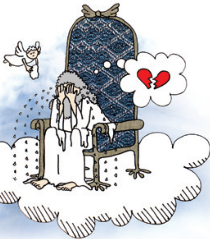
ILLUSTRATION: CHRISTIAN RAHBEK OLSEN

Adam og Eva levede ikke lykkeligt med deres Gud til deres dages ende. I teologisk sprogbrug taler man om et syndefald. En poet vil derimod tale om utroskab, for det var det, det egentlig var. Adam og Eva overtrådte ikke blot deres herres bud, nej de forrædte deres elsker, da de ønskede at være uafhængige af ham. Siden da har Gud grædt over sin utro elsker. Hans elskede mennesker ønsker nemlig ikke et intimt livsfællesskab med ham. Vi vil også dele vort liv med alt muligt andet skidt og ragelse. Noget af Bibelens stærkeste tale om syndens natur finder vi i Ez 16 og Hos