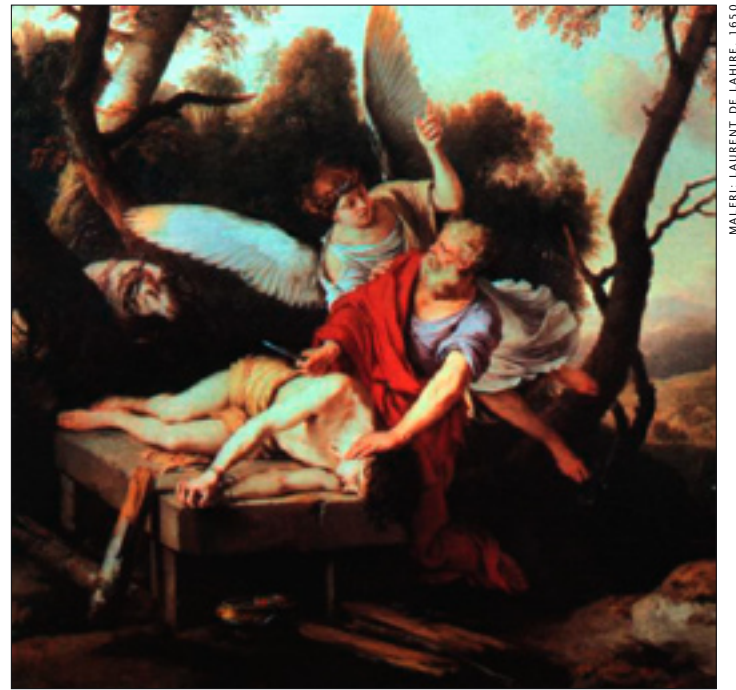
Ofringen af Isak skildres i billedkunsten ofte meget dramatisk.

I løbet af dagen vil vi arbejde med forståelsen af soning og troslydighed i Bibelen og hos Søren Kierkegaard. Vi vil også komme ind på forholdet mellem skrift og tradition i den jødiske, kristne og muslimske tolkning af teksten og endelig vil vi se på, hvordan teksten