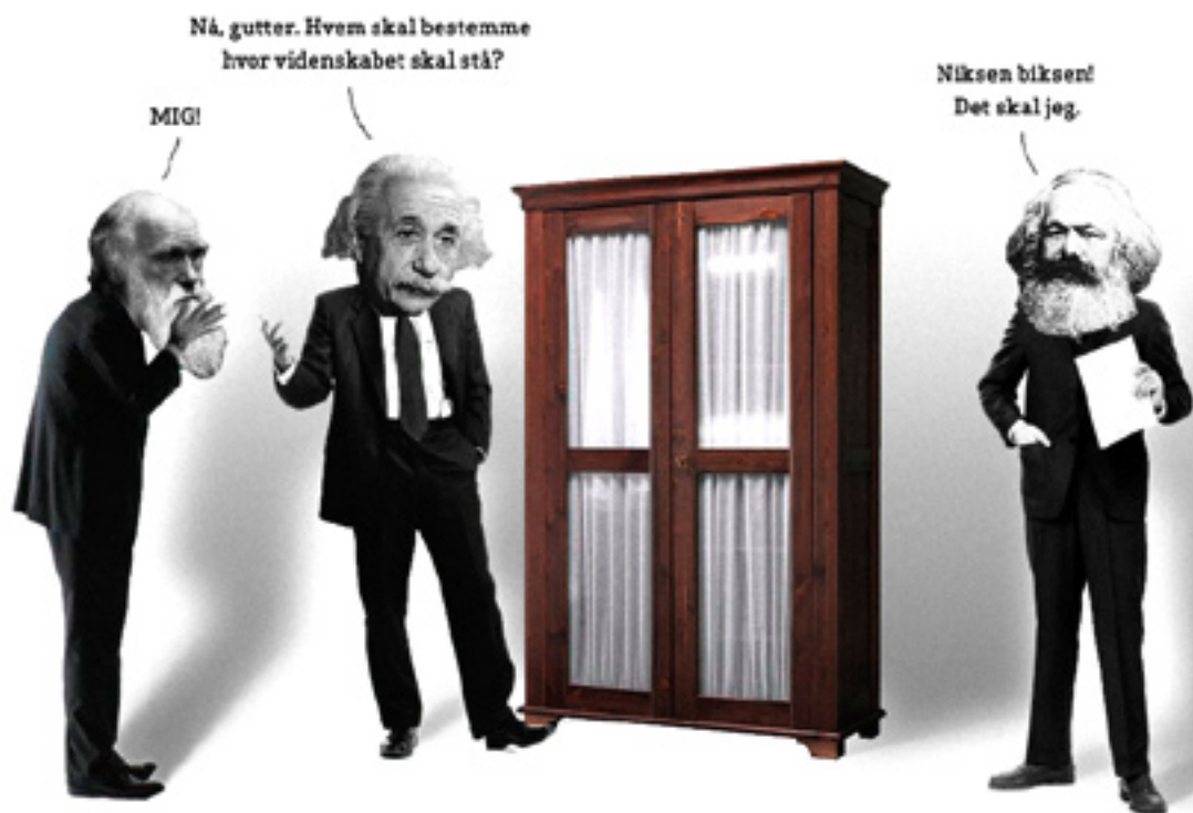
ILLUSTRATION: CHRISTIAN RAHBEK OLSEN

→ | Der findes ikke en universel kraft uafhængig af mennesket, som hedder videnskab.