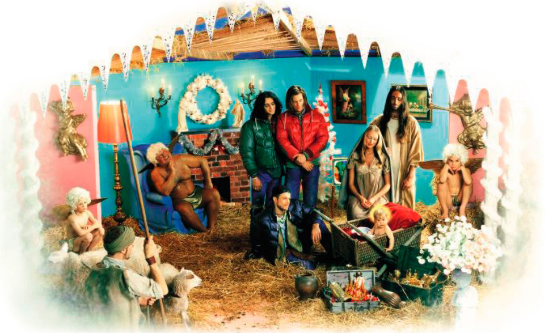
Julens budskab er altså også aktuelt for dagens moderne menneske.

Budskabet flourer og udbredes stadig. Der er én forklaring på det, og det er, at Guds Ånds kraft følger budskabet. Vi er mange millioner i verden som har valgt at bygge vores liv på budskabet. Vi har alle Gud som vores Far og Jesus som vores bror. Jesus har sagt, at vores opgave er at gå ud som Guds repræsentanter