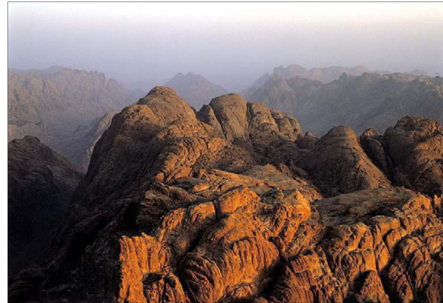
Toppen af Sinai, hvor Moses mødtes med Gud og fik lovens tavler med ned til det ventende folk ved fodet af bjerget.

Ting kan lyde godt. De kan have en vellyd. Og sådan er det også med den fabelagtige lov, Gud gav Israel igennem Moses (5 MOS 4,8). Ingen kan som religiøse jøder feste over Moseloven. De har endog en fest, der hedder Simchat Torah, 'Glæde over Loven'. Sådan var det dog ikke i begyndelsen på Sinaj, da loven blev givet. Efter synden med guldkalven sad de og græd over de knuste tavler (2 MOS 33,4). Senere indså den omvendte Torah-student Paulus, at Loven også gør vé: hver mund skal lukkes og hele verden stå strafskyldig over for Gud (ROM 3,19FF). Og sådan var det også fra første færd i Anden Mosebog 19-20.