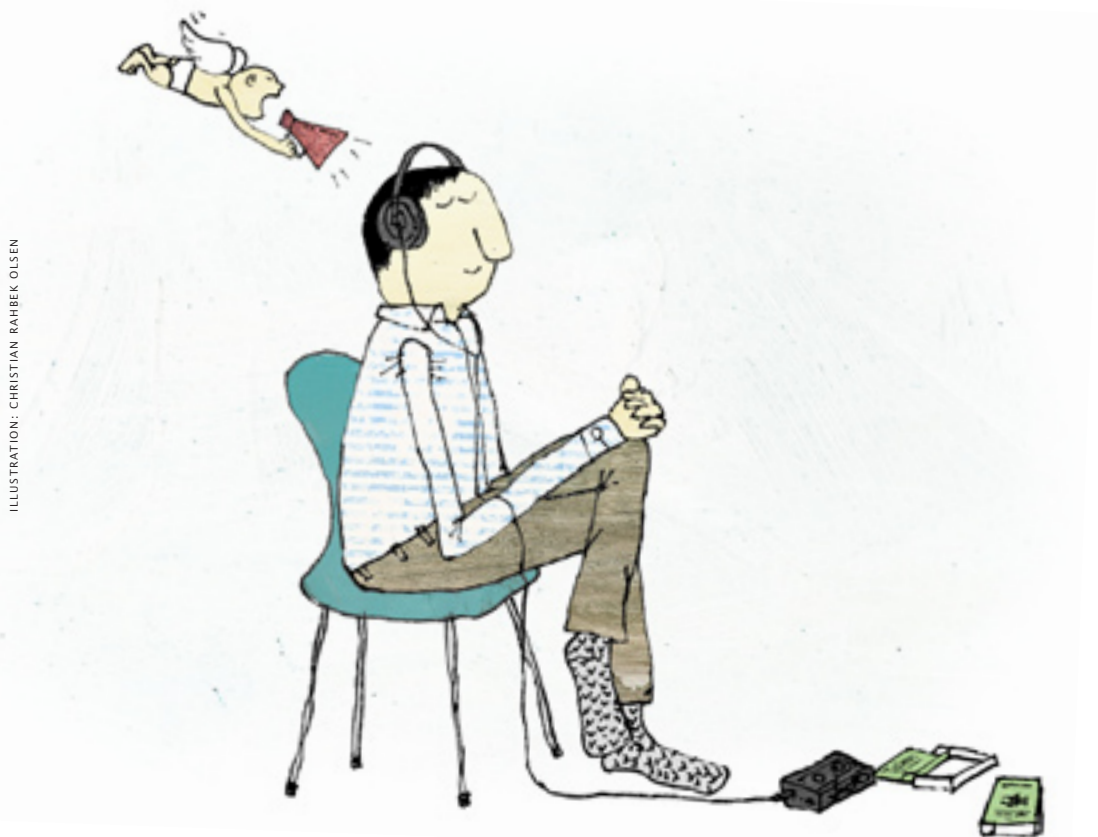
ILLUSTRATION: CHRISTIAN RAHBEK OLSEN

Hvis vi lytter for meget til mennesker, kan vi let komme til at overheøre hvad Gud siger.