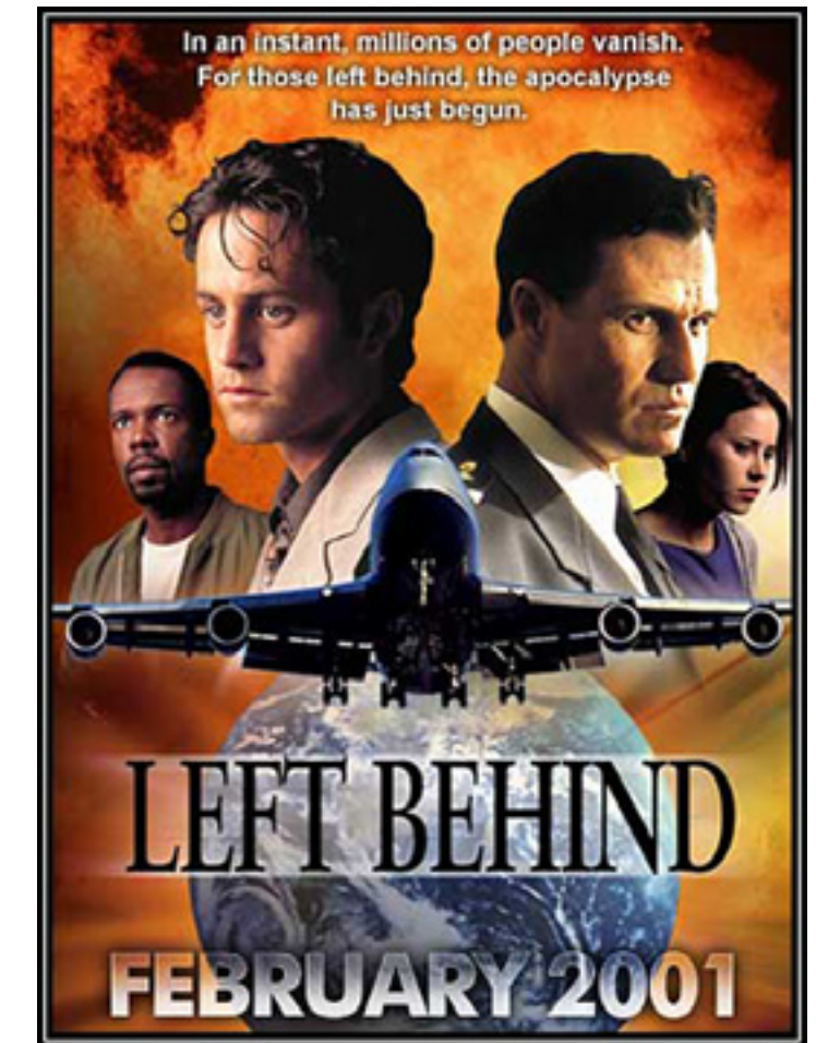
Filmplakaten til Left Behind fra 2001.