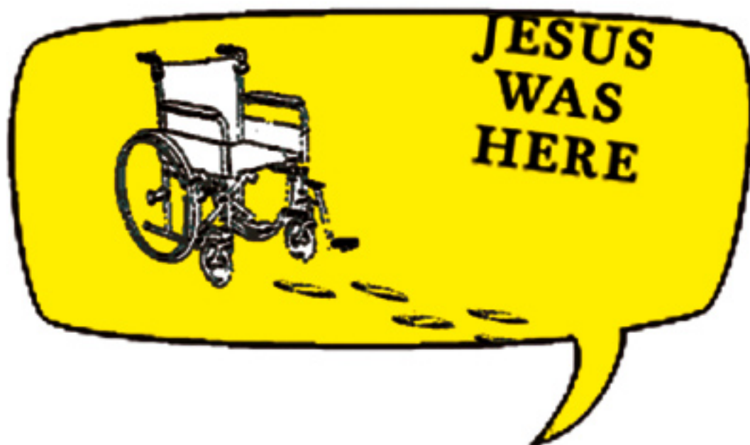
ILLUSTRATION: CHRISTIAN RAHBEK OLSEN