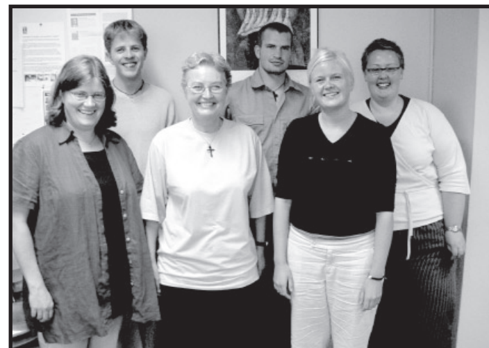
Det nye TKM-hold, der startede i sommers, hvoraf to personer går på LMs 1-årige linie.