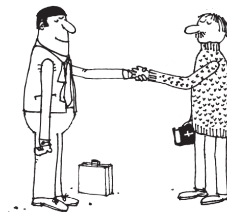
Internt samarbejde og arbejdsdeling var på dagsordenen for DBI's styrelse og ansatte.