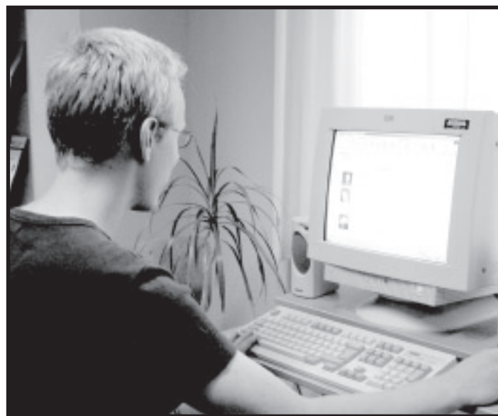
DBI begynder nu at udbyde netbaseret undervisning.