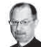
Af Peter O.K. Olofson.