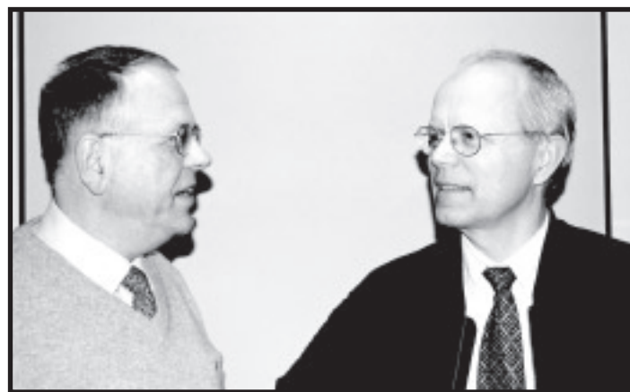
Den nye og den gamle...