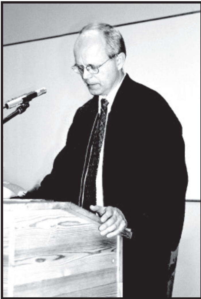
»Meget enkelt sagt, så er det helt afgørende, om vi virkelig forkynner selve kernesagen i evangeliet.«