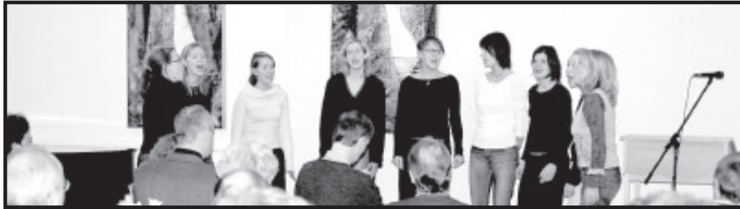
Den 22 marts havde DBI Inspirationsdag og Årsmøde. Vi havde en dejlig dag med god tilslutning.