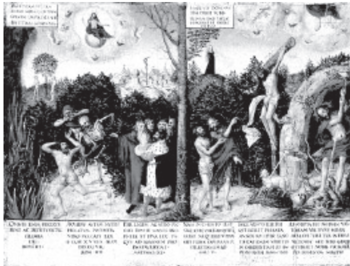
Martin Luthers gode ven maleren Lucas Cranachs tegning fra 1551, som skal illustrere et menneskes forhold til på den ene side loven og på den anden side evangeliet.

Nogle synes at være af den opfattelse at læren om lov og evangelium er opfundet af Paulus, genopdaget af Luther og noget, som den teologiske forskning i dag har lagt bag sig. Denne opfattelse er imidlertid fundamental forkert. Læren om lov og evangelium er nemlig en grundtanke, som ligger dybt i alle de bibelske skrifter. Den dobbelthed, som vi finder i Bibelen, har nemlig i sidste ende sit udspring i Guds eget væsen. Den hellige Gud er både ham, der vredes over og hader alt syndigt og urent og kræver fuldkommenhed (loven); men samtidig ham, der elsker os mennesker så højt, at han ofrede det kæreste, han havde, for at frelse os (evangeliet).