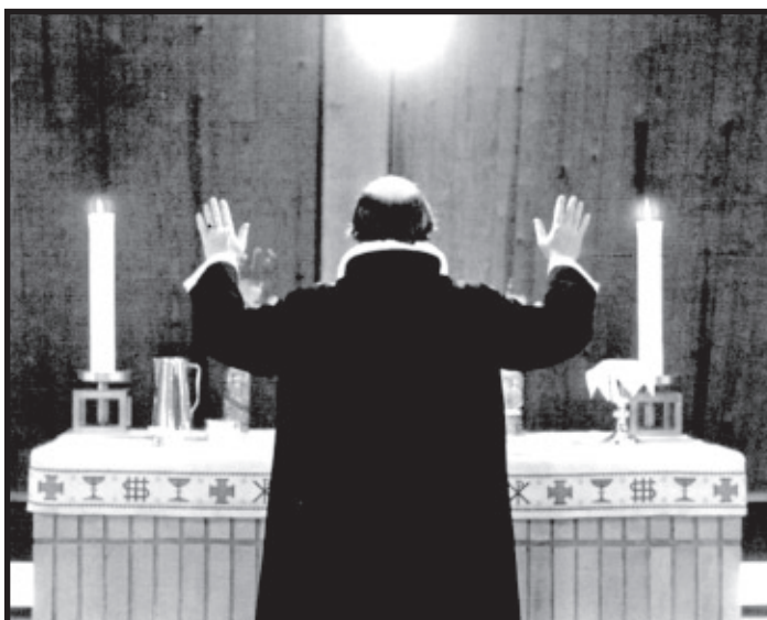
Der er intet vundet ved at være hverken teologiens, lutherdommens eller DBI's discipiel, hvis man ikke bliver 'himmerigets discipel'.

Og det er ikke sagt i foragt for god fagteologi. Mange (de fleste?) af kirkens forfaldsperioder skyldtes nemlig læremæssige afsporinger. Og mange (de fleste?) fornyelsesperioder begyndte, da mennesker ved Guds ånd blev fornyet i troens centrale indhold. Derfor spiller bibelsyn, forståelsen af lov og evangelium og besindelsen på de centrale pointer i troen en meget stor rolle for os på DBI. Hvis vi går vild her, kan det nemlig være lige meget, hvor dygtige vi er på alle andre punkter.