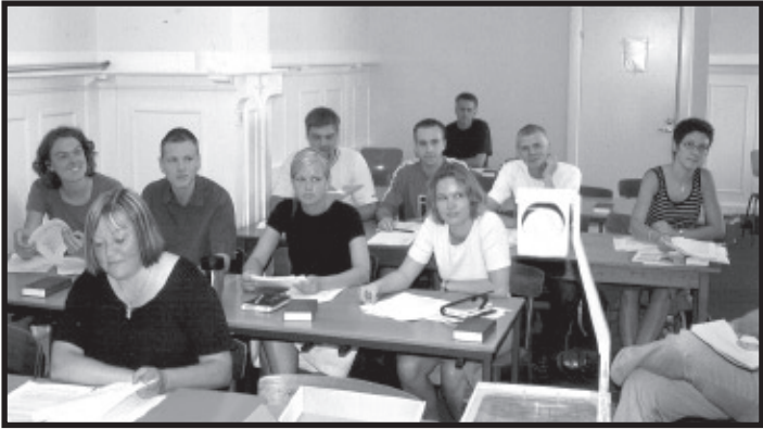
Tolv nye TKM-studerende ser frem til en masse undervisning på DBI.

Den 19. august begyndte tolv nye TKM-studerende på DBI. De kommer fra hele landet og har forskellig kirkelig baggrund men flest fra Indre Mission. Sidste år var den største gruppe fra Luthersk Missionsforening. Når vi ser på den samlede studenterflok viser det, at DBI har kontakt til et meget bredt bagland, da også mange fra bibeltro folkekirke-menigheder deltager i vores undervisning.