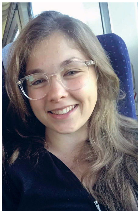
Måske er den side du allermindst kan lide ved dig selv, den side Gud allerbedst kan lide ved dig.

Jeg tror, vi skal lade Gud transformere vores hjerter og bede om tilgivelse, når vi sårer andre. Men historien om Jonas betrygger mig om, at