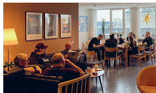
Det var godt at møde studerende og ansatte igen til årets semesterstart.