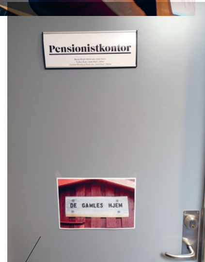
Humor er der masser af på pensionistkontoret. Det er tydeligt allerede inden man kommer ind.

rer jeg også til her", siger han. "Jeg har en opgave og føler stadigvæk, at jeg er en del af det store arbejdsfællesskab, som vi er på DBI."