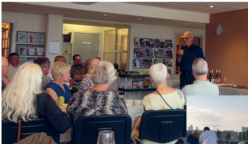
Efter forelæsningen var der reception med lidt godt at spise, og mange benyttede lejligheden til at komme med en hilsen til rektor.