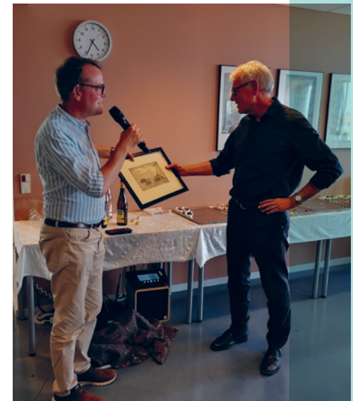
Der var gaver og gode ord til vores rektor ved receptionen.

Relationen til de studerende betyder også meget. Det kommer til udtryk både i undervisningen, i hverdagens samtaler og i hans gæstfrihed.