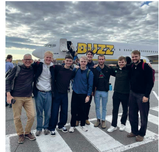
”Det, som kom til at betyde mest for mig i løbet af konferencen, var mødet med kristne ledere fra andre lande”

Konferencen gav mig nemlig også en erkendelse af, at alle andre ledere er lige så meget på vej i deres tjeneste, som jeg er. Det var både en beroligende erkendelse, men også udfordrende.