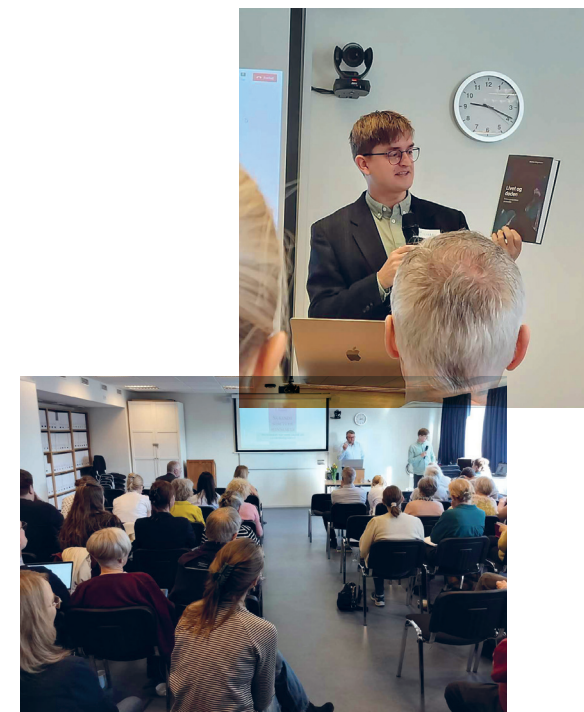
Hvordan må vi være overfor hinanden? Hvad er vores plads i verden? Hvornår dømmes vi andres liv som uværdige?

Dagen afsluttedes med en paneldebat, hvor spørgsmålet ”svigter kirken, hvis den ikke har en klar etik?” blev diskuteret. Mange spændende