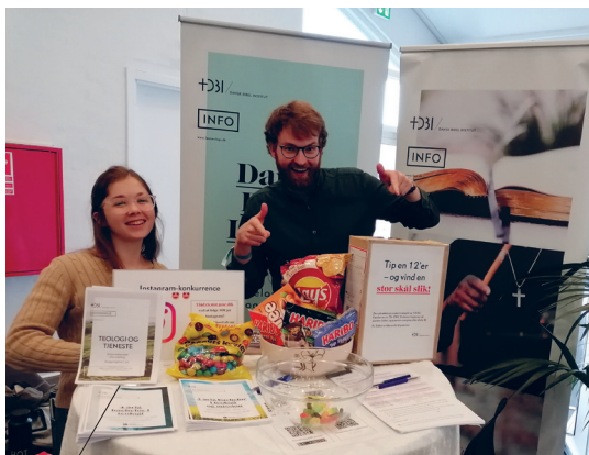
Det blev til mange gode snakke ved DBI's stand på årets påskelejr.