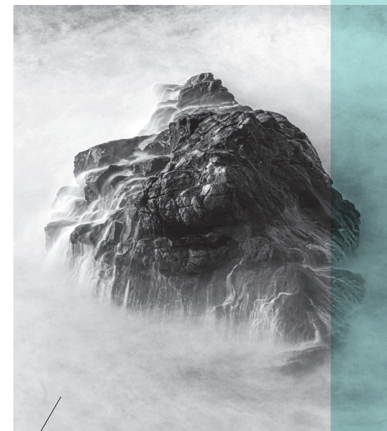
I disse usikre tider træder Gud os i møde som klippen. Hos ham kan vi finde fodfæste og tryghed.

Vi lever i en ustabil tid, hvor trusler fra flere sider kan være som en vandflod, der skyller alt væk på sin vej, og vi føler os svage og magtesløse. Vi ved ikke, hvad vi skal og kan gøre. Men i netop denne situation, har vi måske en særlig anledning til at opdage dette stærke billede af Gud: Klippen.