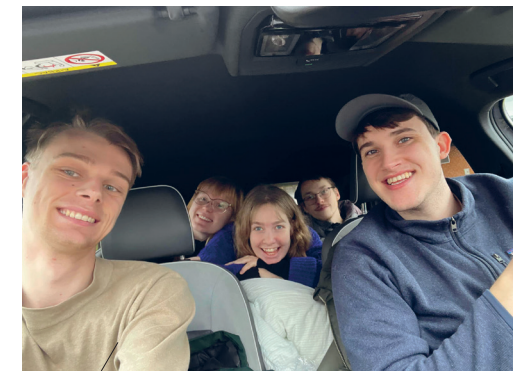
Det bliver til en hel del kilometer på landevejene, men så er der tid til at evaluere prædikenerne og snakke teologi med meget mere.