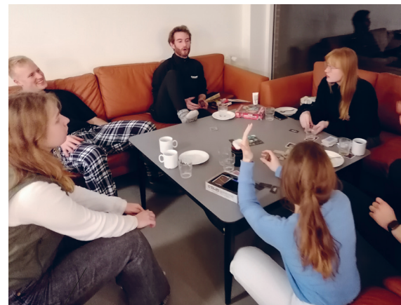
Tid til hygge, spil og snak styrker fællesskabet mellem de studerende.