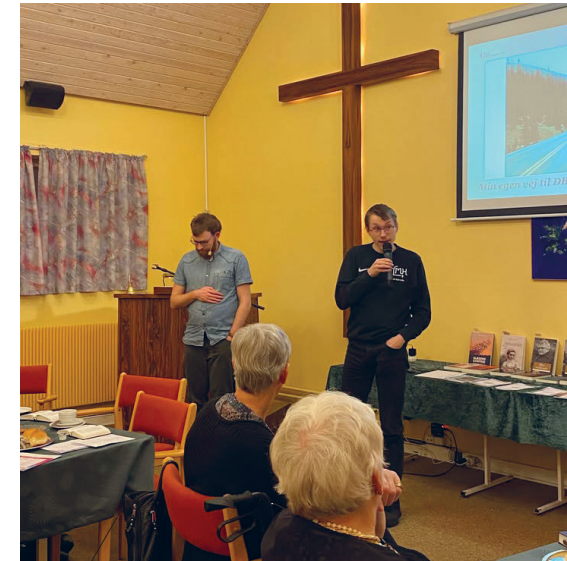
Ved hvert møde var der både forkyndelse og information om DBI.

Infoturen er både en god mulighed for at fortælle om DBI, men er også en god øvelse for de studerende, som udover at prøve kræfter med forkyndelse også får et mødet med det "bagland", som måske engang skal ansætte dem. TAK fordi I tog godt imod os!